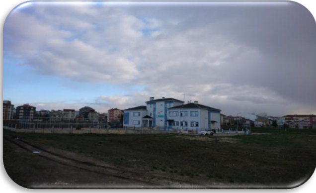
Okulumuzun Dışardan Görünümü