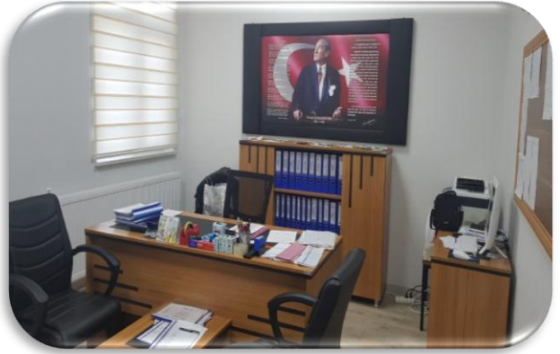
Müdür Yardımcısı Odası