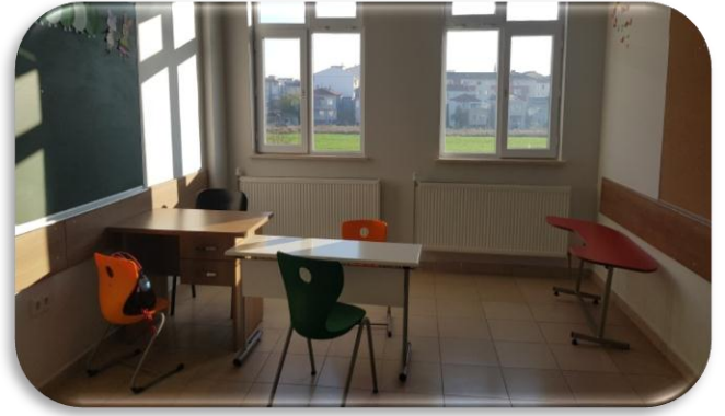
Bireysel Eğitim Sınıfı