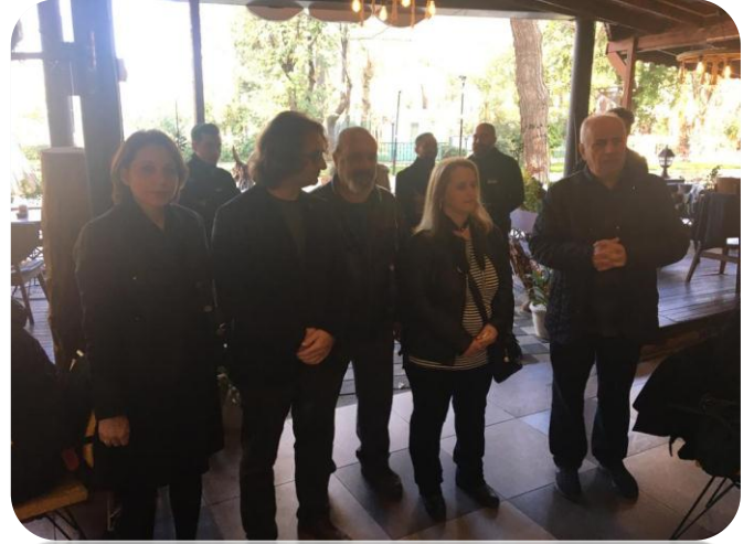
24 Kasım Okul-Aile Birliđi Kahvaltı Etkinliđimiz